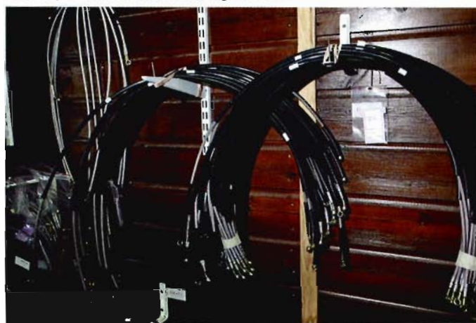
Les durites aviation sont le complément indispensable d'un freinage puissant.

« Look, puissance, voilà de quoi équiper votre machine préférée. »