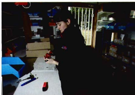
Un ultime contrôle minutieux avant l'expédition à l'autre bout du monde.