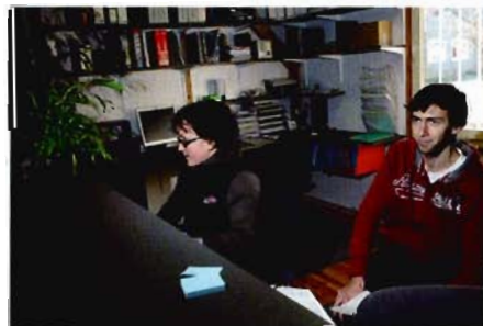
Pas une minute de répit pour le personnel.