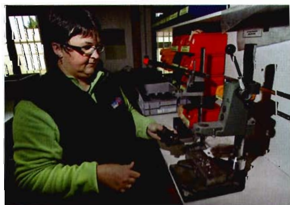
Outils spécialisés, main d'œuvre qualifiée sont les gages de qualité Beringer.