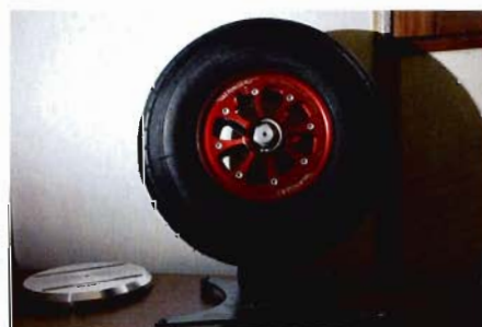
Le système de freinage est intégré à la roue. Celle-ci sera destinée à un avion.