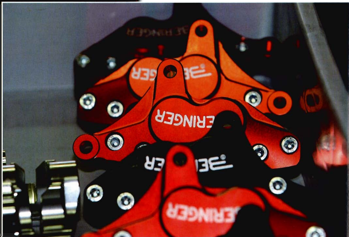
L'anodisation des pièces apporte indéniablement un plus au look Beringer.

Une organisation rigoureuse dans la salle des pièces détachées pour éviter la rupture de stock.